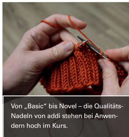
Von „Basic“ bis Novel – die Qualitäts-Nadeln von addi stehen bei Anwendern hoch im Kurs.

Die Rundstricknadeln „Basic“ sind nach wie vor die Nr. 1 bei addi – ebenso beliebt ist die neue addi- Novel -Familie. Neben den viereckigen Lace -Rundstricknadeln im ergonomischen Design mit der strukturierten Oberfläche konnte addi das Programm noch ausbauen, sodass es jetzt auch die addi-CraSyTrio Novel gibt, addi-Jackenstricknadeln Novel und das addiClickSystem mit den Novelspitzen in kurz und lang.